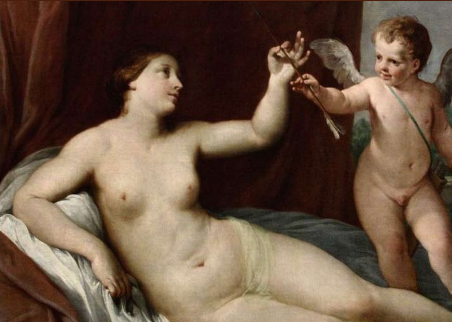
Guido Reni Cupido e Venere - 1640