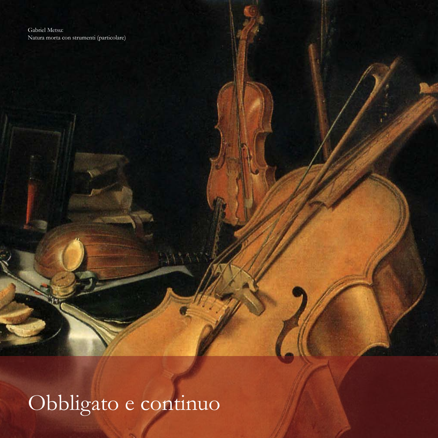
Gabriel Metsu: Natura morta con strumenti (particolare)